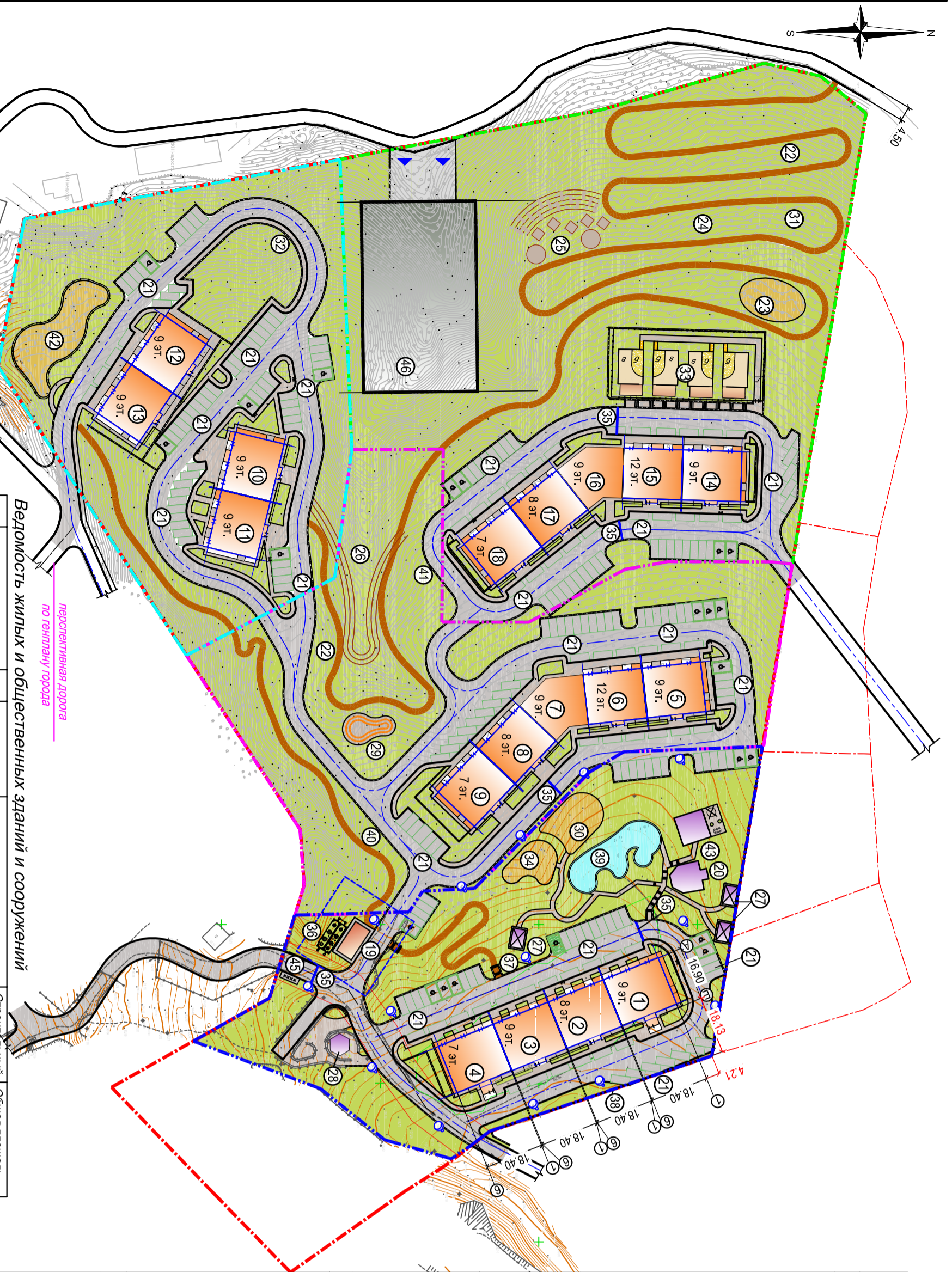
Ведомость жилых и общественных зданий и сооружений